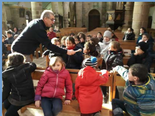
Célébrations aux temps forts de l'année

Récréation commune de la maternelle au CM2