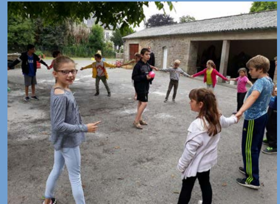
Pot de départ des CM2

Récréation commune de la maternelle au CM2