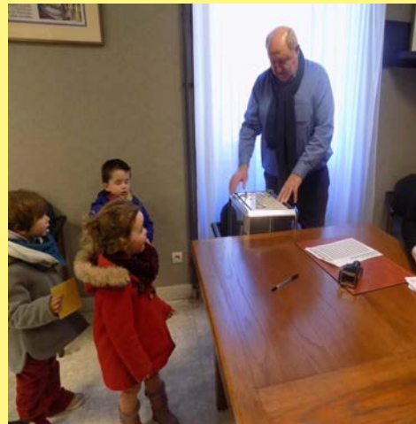
Ateliers « Semaine du goût » à l'EHPAD