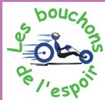
Participer une action solidaire : collecte de bouchons