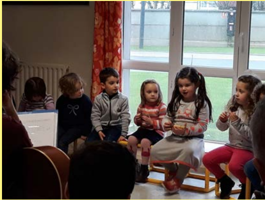
Réalisation d'un spectacle de musique à l'EHPAD