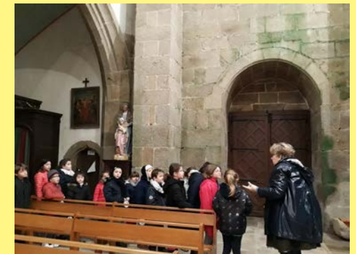
1 heure d'éveil à la foi / de culture religieuse