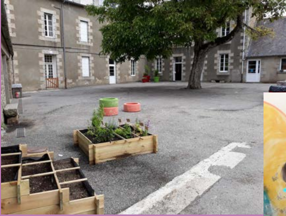
Finir le projet de rénovation de la cour de récréation